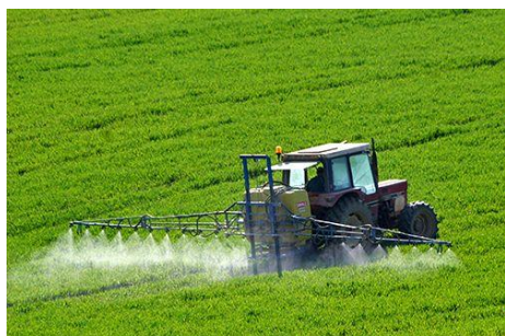
Figuur 3: Pesticiden als sproeimiddel wordt vaak gebruikt in landbouw.

Verder leeft ook de discussie of het ethisch is in een wereld met voedselschaarste, voedingsgewassen te gebruiken om kunststof te produceren. De milieu-impact hangt ook af van het al dan niet gebruik van pesticiden als sproeimiddel en van het watergebruik (figuur 3).